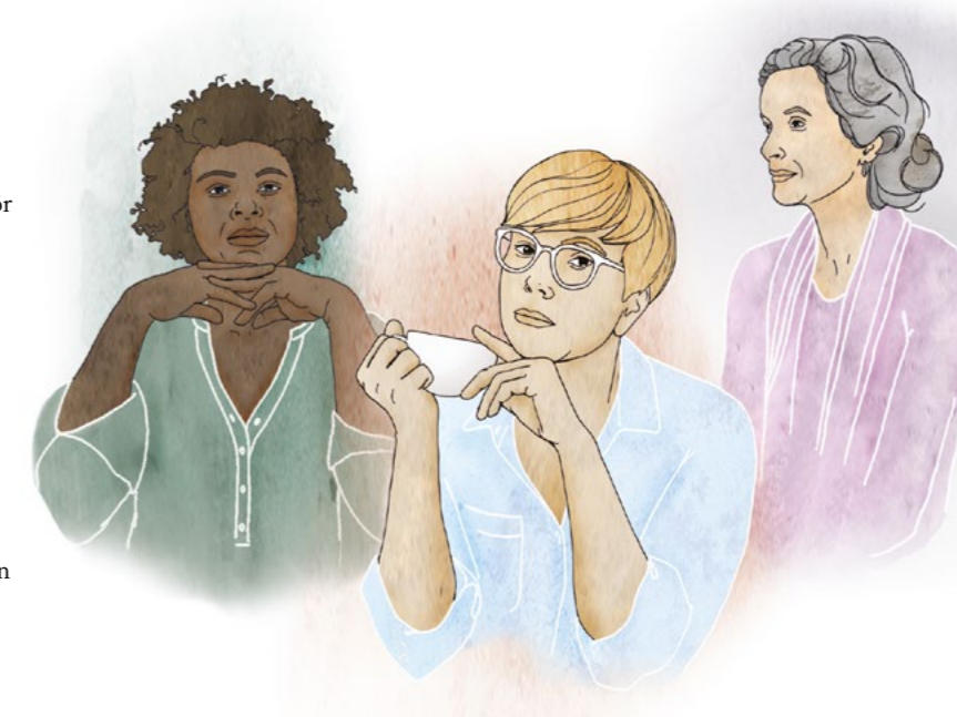
Illustration: Jenny Almén

HELA SAJTEN FINNS både på svenska och engelska och dessutom finns information om Kvinnofridslinjen på 30 olika språk, och teckenspråk. En av förbättringarna som gjorts efter önskemål från användare är ett nytt tydligare formulär för beställningar av informationsmaterial om Kvinnofridslinjen.