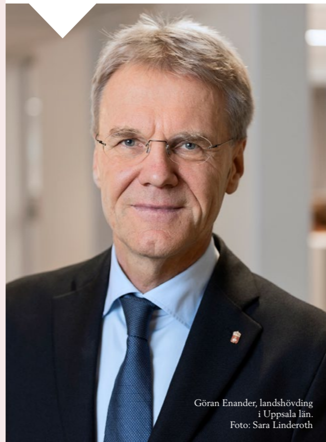
Göran Enander, landshövding i Uppsala län.