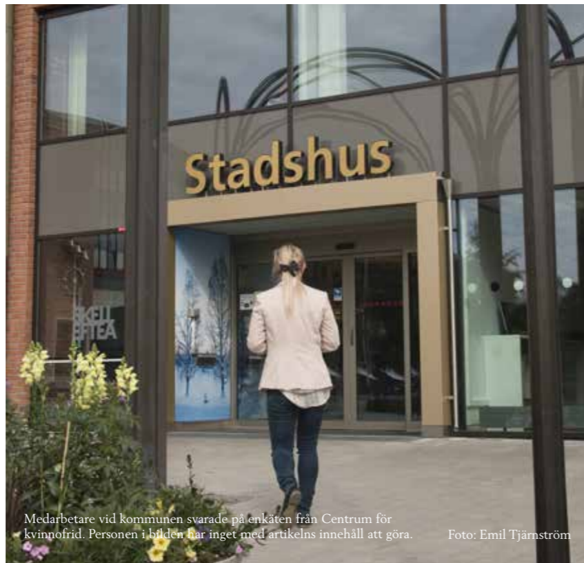
Medarbetare vid kommunen svarade på enkäten från Centrum för kvinnofrid. Personen i bilden har inget med artikels innehåll att göra.

Som en del i kartläggningen skickades även en enkät till 120 verksamhetschefer i kommunen med frågor om hur de arbetar mot våld, 39 av cheferna svarade. Dessutom intervjuades fyra chefer från verksamheter som CFK samarbetar med. Svaren visade att bara två verksamheter, kvinnojouren och Åklagarmyndigheten, förde statistik över antalet ärenden som rör våld i nära relationer.