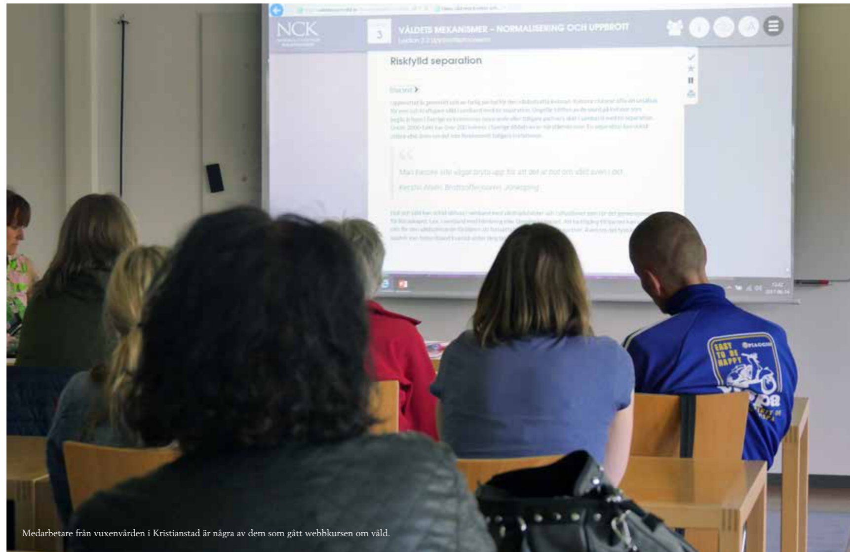
Medarbetare från vuxenvården i Kristianstad är några av dem som gått webbkursen om våld.

– Intresset för pilotutbildningen var enormt stort med deltagare från sju län. Vi erbjuder nu utbildningen till yrkesverksamma i hela landet som