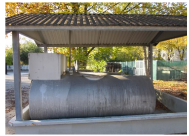
Cisterner sedda från långsidan